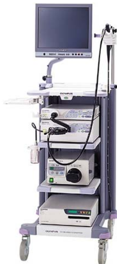
内視鏡統合ビデオシステム「VISERA ELITE(ピセラエリート)」シリーズ

手術治療につきましては、腹腔鏡下手術（腎・副腎など）、内視鏡手術（膀胱）、内視鏡とレーザー装置を用いて行う手術（前立腺・尿路結石）など低侵襲な手術を中心に行い、その他一般的な泌尿器科手術も行っていく予定です。さらに令和5年春に新病院が完成予定ですが、新病院開院後には最新医療である前立腺がんに対するロボット手術（ダビンチ手術）を導入する予定です。将来的には診療状況に応じて腎部分切除術、膀胱全摘除術および腎盂形成術などロボット手術の適応拡大も考えていくことになると思います。