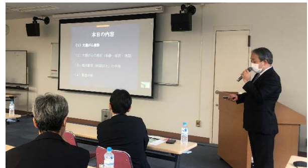
「大腸がん ～検診から超高齢者手術・緊急 手術まで～」