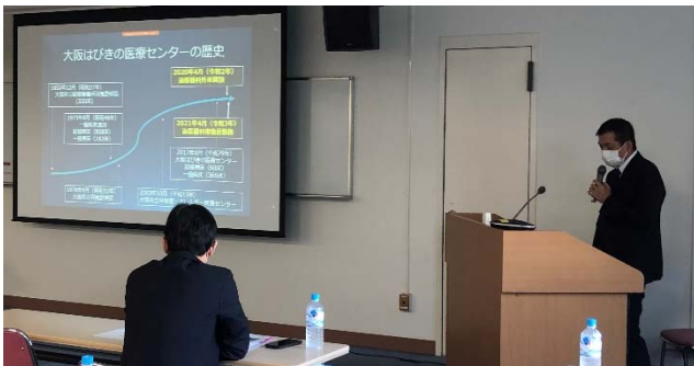
「大阪はびきの医療センター泌尿器科と 前立腺がんの疫学」

10月16日（土）当センターにて第7回はびきのアカデミーを開催しました。院外から4名、院内から18名の参加をいただき、活発な質疑応答、対面ならではの意見交換をすることができました。ご多忙の中、ご出席いただいた皆様に厚くお礼申し上げます。