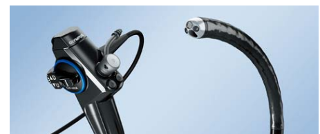
膀胱腎盂ビデオスコープ